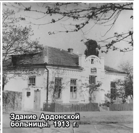
Здание Ардонской больницы. 1913 г.