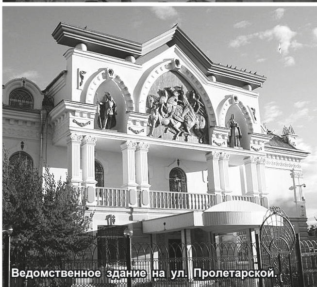
Ведомственное здание на ул. Пролетарской.