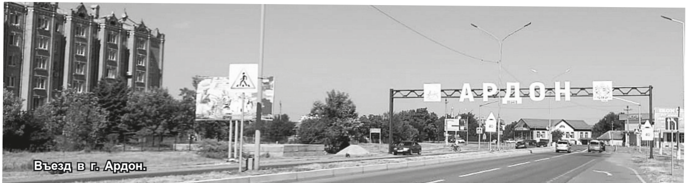
Въезд в г. Ардон.