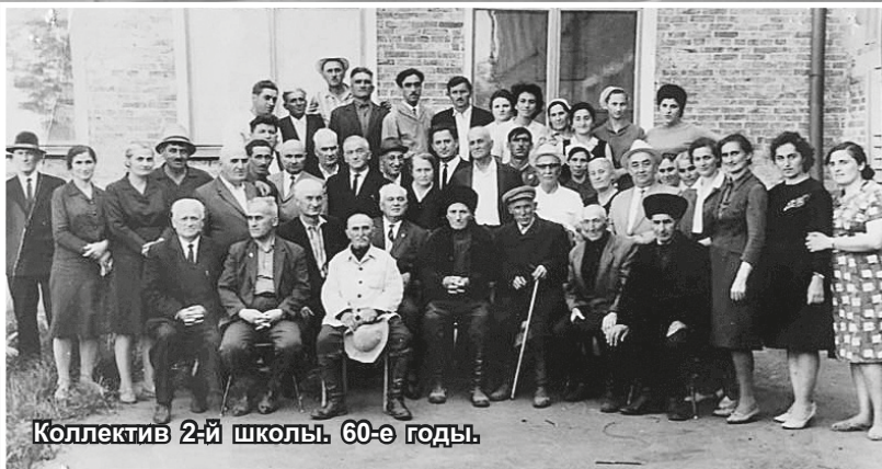
Коллектив 2-й школы. 60-е годы.