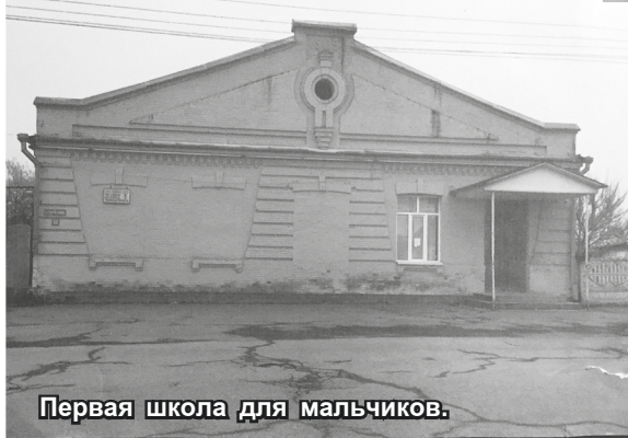
Первая школа для мальчиков.