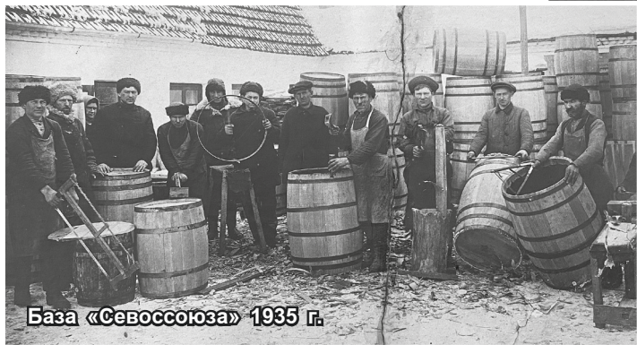
База «Севосоюза» 1935 г.