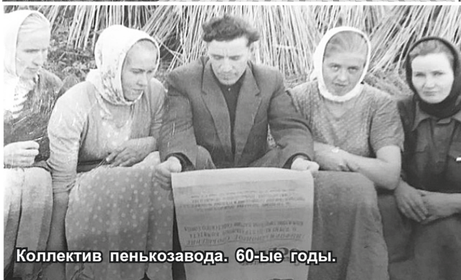
Коллектив пенькозавода. 60-ые годы.