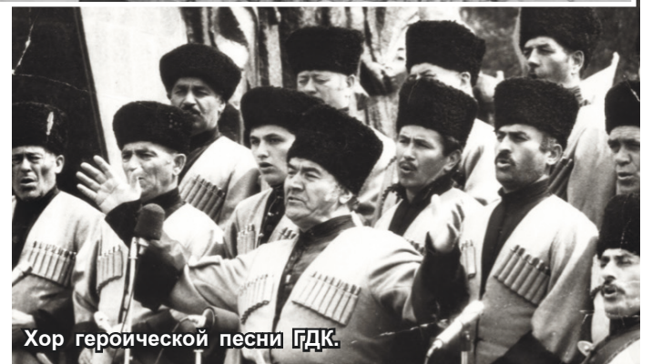
Хор героической песни ГДК.