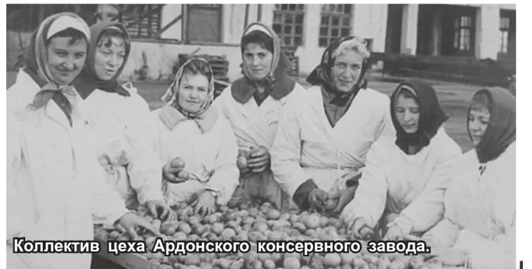
Коллектив цеха Ардонского консервного завода.