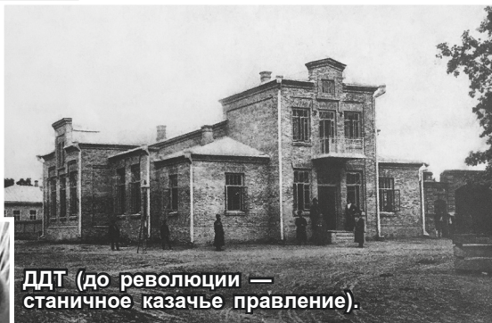
ДДТ (до революции — станичное казачье правление).